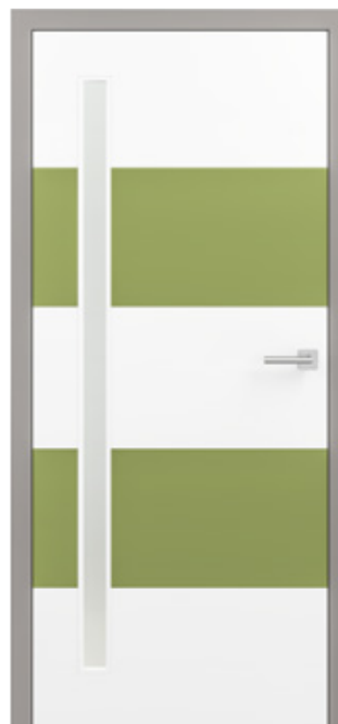
KÖ-PRBILD-ET005 Linientür Optima Q2 Weißlack und kiwigrün mit farblich abgesetzter Zarge greystone aus der Köhnlein Farblack-Kollektion