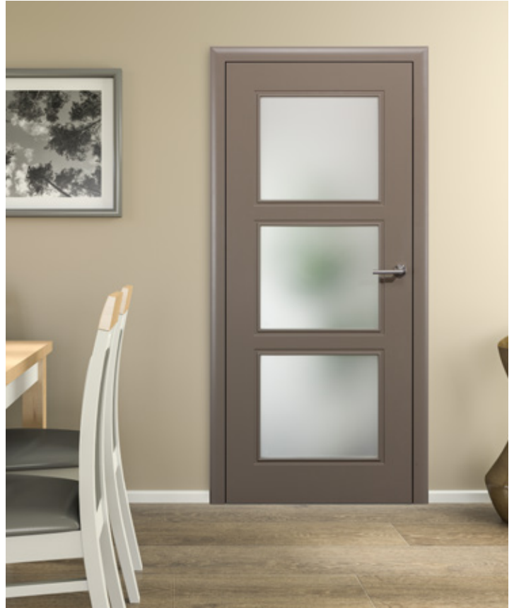
KÖ-PRBILD-00013 Köhnlein Eleganca 3R in beige-grau (RAL)