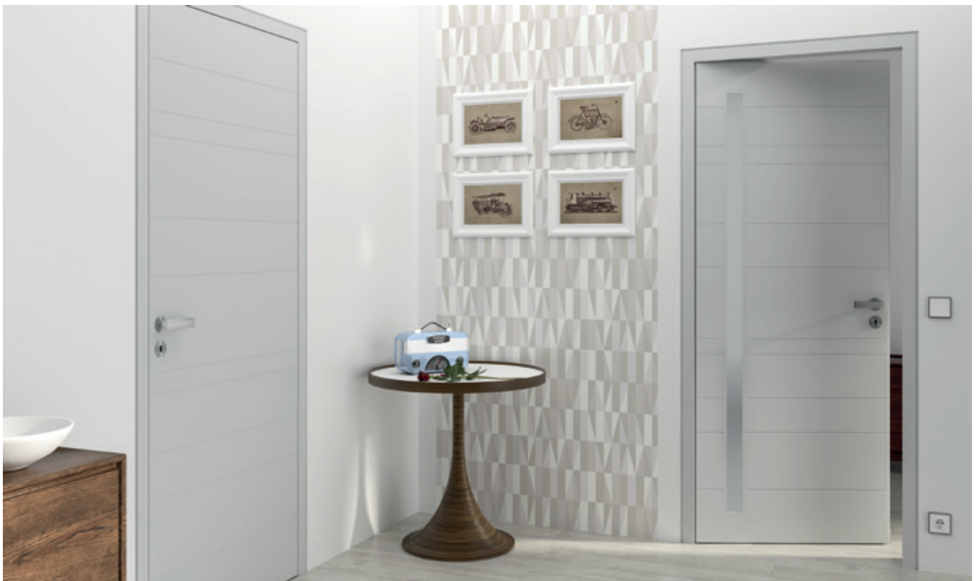
KÖ-PRBILD-00004 | Linientür Mare mit Linienfräsung Planfuge in lichtgrau aus der Köhnlein Farblack-Kollektion mit dem System KÖNOPLANin, wandflächenbündige Zarge mit in die Leibung öffnendem Türblatt