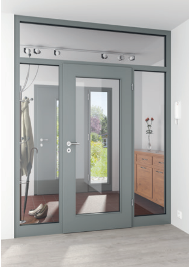
KÖ-PRBILD-00012 Köhnlein Windfangelement und Haustür (im Hintergrund) fenstergrau (RAL) lackiert