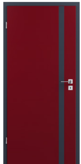
KÖ-PRBILD-ET006 Linientür Optima S in Rubinrot (RAL) in Kombination mit graphitgrau aus der Köhnlein Farblack-Kollektion

KÖ-PRBILD-00002 | Stiltüren Stil E mit abgeplatteten Füllungen als Rundbogenelemente 1-flg. und 2-flg. mit der Oberfläche Weißlack und Langschild-Drückergarnituren, Modell Oviedo in Messing poliert und Keramik weiß.