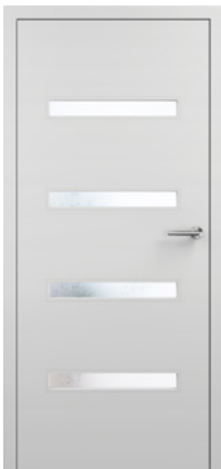
KÖ-PRBILD-ET001 Türmodell Standard glatt mit Design-LA W-4XS, Farblack lichtgrau aus der Köhnlein Farblack-Kollektion

KÖ-PRBILD-00011 | Köhnlein Farblack-Kollektion in der Gesamtübersicht, unzählige weitere Farblacke aus RAL- oder NCS-Farblackkolektionen