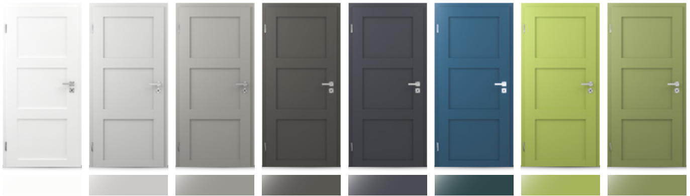
FARBLACK VERKEHRSSWEISS FARBLACK LICHTGRAU FARBLACK GREYSTONE FARBLACK ONYXGRAU FARBLACK GRAPHITGRAU FARBLACK AZURBLAU FARBLACK FRESHGRÜN FARBLACK KIWIGRÜN