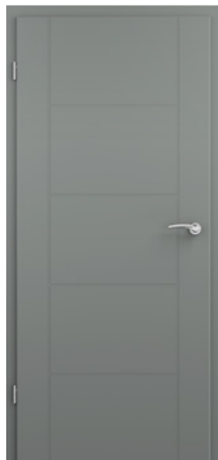
KÖ-PRBILD-ET003 Neues Linientür-Modell Oros G4 mit Linienfräsung Planfuge, Farblack onyxgrau aus der Köhnlein Farblack-Kollektion